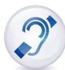
Handicap auditif *

* Du fait de cette période épidémique et afin de faciliter la lecture labiale pour les personnes sourdes ou malentendantes nos équipes disposent de masques inclusifs.